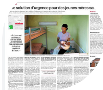
Les pavillons Auvergne et Acacia à l' EPS Ville-Évrard

Pour garantir un accompagnement adapté, plusieurs travailleurs sociaux détachés de quatre services de La Main Tendue ont assuré des permanences, permettant aux personnes accueillies de bénéficier d'une évaluation sociale, transmise ensuite au SIAO. Au total, ce gymnase a accueilli 77 personnes , dont 16 femmes seules , 18 femmes avec enfants , et 43 enfants , parmi lesquels 3 bébés . À la fermeture du gymnase, l'ensemble des ménages a été orienté vers des centres d'hébergement d'urgence en Seine-Saint-Denis et dans d'autres départements.