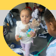
CHU Nicole Leguy et la périnatalité

L'équipe, composée de travailleurs sociaux , d'une éducatrice de jeunes enfants et d'une auxiliaire de puériculture , est spécialement formée pour offrir un accompagnement axé sur le soutien à la parentalité et le suivi des nourrissons. Elle veille non seulement à la mise à l'abri rapide des familles et de leurs nourrissons en situation de rue, mais leur offre également un lieu de vie sécurisant qui leur permet de prendre confiance en leurs capacités pour construire un projet de vie. En outre, elle propose un accompagnement sanitaire et social , en tenant compte de l'évaluation effectuée par l'équipe périnatalité du SIAO .