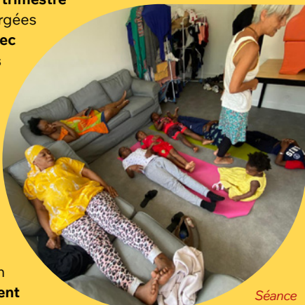
Séance de Yoga pour les enfants et les mamans